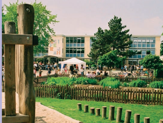
Links: Blick vom Spielhügel über Schulgarten auf -Neubaustrakt

Schulhof 2002: Um einiges aufgepeppt zeigt sich der Schulhof im neuen Jahrtausend. Nachdem schon im Jahr 2000 eine bunte Sitzgruppe bzw. Freiklasse von Förderverein und Eltern installiert wurde (links neben dem Schulgarten), kamen 2002 zwei Abenteuertürme, verbunden durch eine Wackelbrücke hinzu. Sie geben zusammen mit der Bergsteigerrampe dem Spielhügel den letzten „Kick“. Der Spielhügel war schon immer ein beliebter Aufenthaltsort der Kinder in den Pausen.