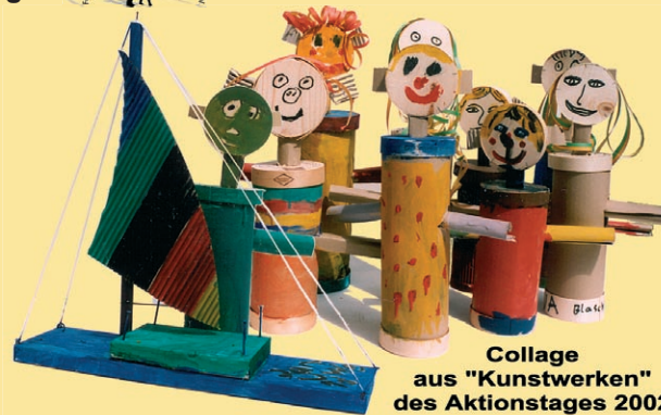
Collage aus "Kunstwerken" des Aktionstages 2002

Impressum: Herausgeber: Förderverein der Grundschule Biebesheim e.V. (Ausgabe 2005) Gestaltung: Hans-Joachim Gallmeier Druck: Offsetdruck Schaffner